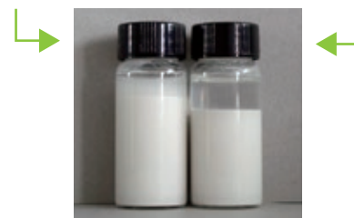
CaCO 3 スラリー

Prox B 03 - 0.5% + Stab 25 B - 0.5% Prox B 03 - 0.5% + product 1 - 0.5%